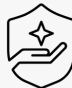
3 jaar haal- en brengservice UM963E