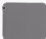
HP 100 desinfecteerbare muispad 8X594AA